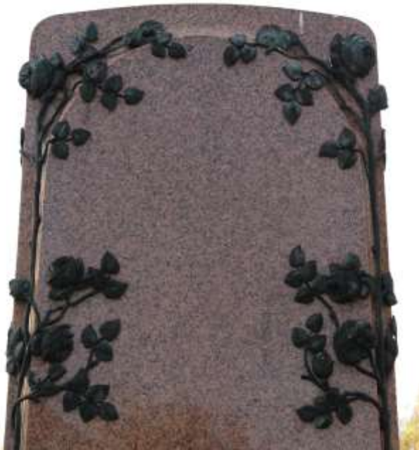
Grafzerk Victor Dumon, in labrador rouge met bronsbeslag, A/0/1, Stedelijke begraafplaats Blankenberge