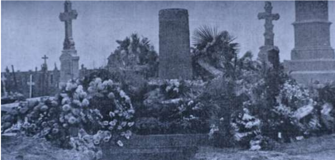
Bloemenzee bij de begrafenis van Victor Dumon