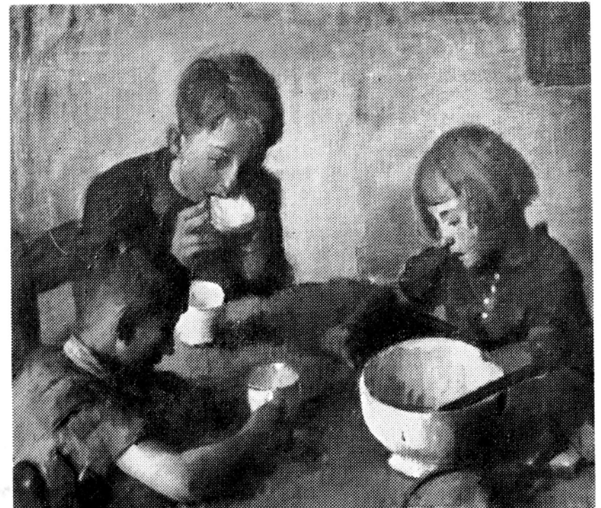
Kinderen aan hun maal