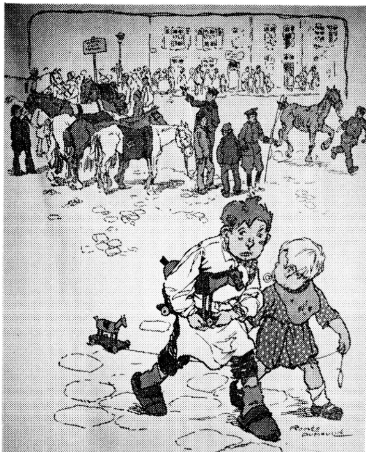
« Deze zullen ze alvast niet hebben », denken de kinderen die met hun houten paardjes, tijdens de opeising der paarden vluchten. (tekening van Dumoulin).