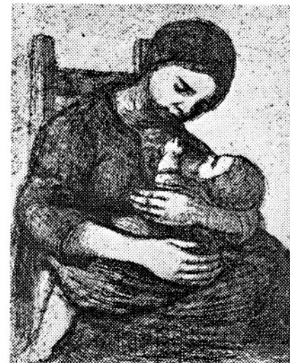
Een ets, van Jacob Smits