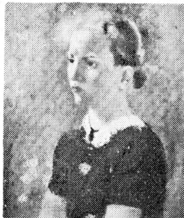
Meisjesportret door Leon De Vos