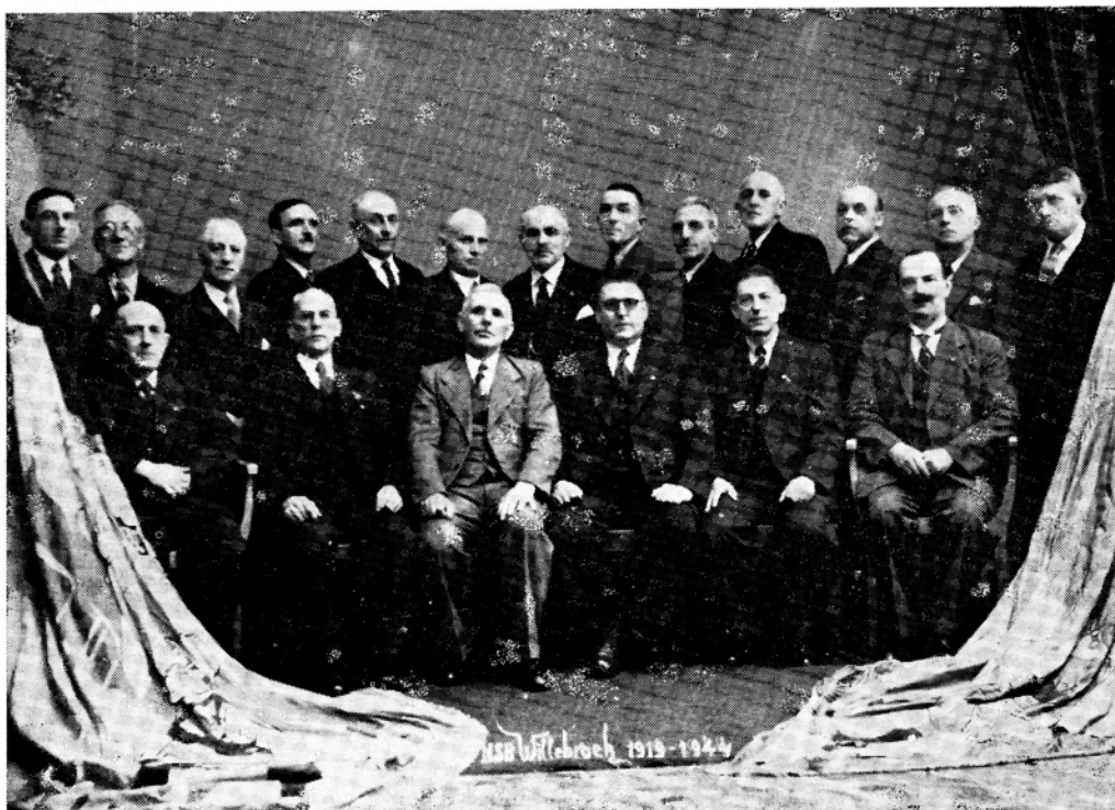
HERNIEUWDE BESTUUR VAN N.S.B. 1919 - 1944