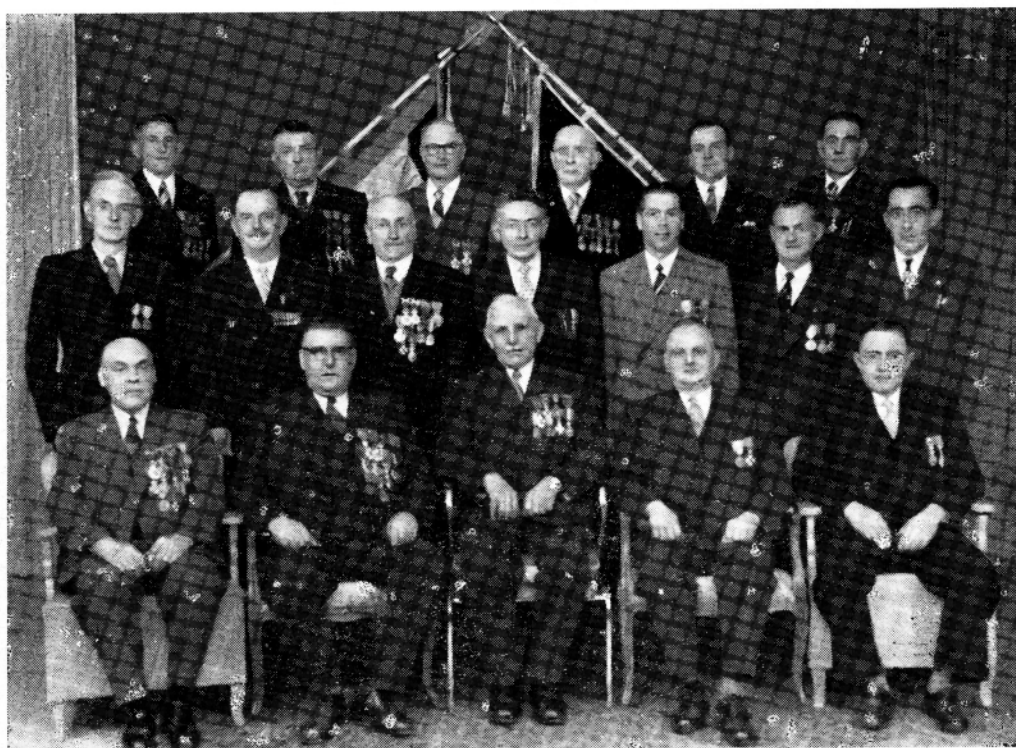
HERVORMD BESTUUR 1914-18 EN 1940-45