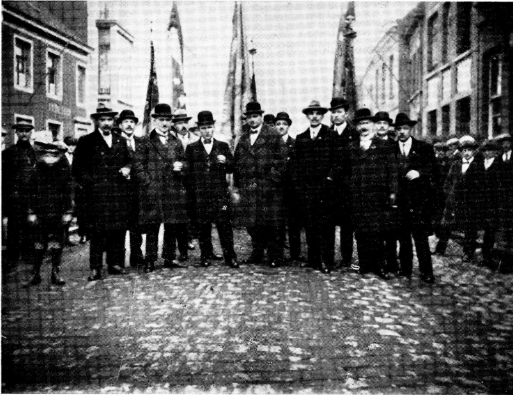
Zicht genomen vóór het oude lokaal «Vreugdegalm» in afwachting van het vertrek voor een propagandatocht.

De NSB-afdeling Willebroek, die op zaterdag 11 en op zondag 12 november 1978, de 60e verjaardag van haar ontstaan heeft gevierd, werd in feite op 17 december 1916 gesticht. Ten einde de moreel aan het IJzerfront hoog te houden, werd er op die dag, in een aan de steenweg Veurne-leper, op het gehucht «Hoogheide-Linde» gelegen herberg, een samentreffen voor de Willebroekse soldaten gepland.