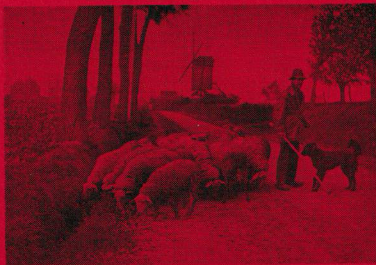
De lente treedt aan... Een landelijk tonaeltje.