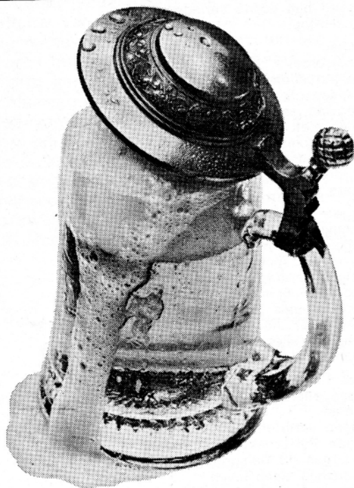
Wiel's...Wielemans Kwaliteitstraditie sinds 1862

Diploma hotelschool Feestzaal ter beschikking