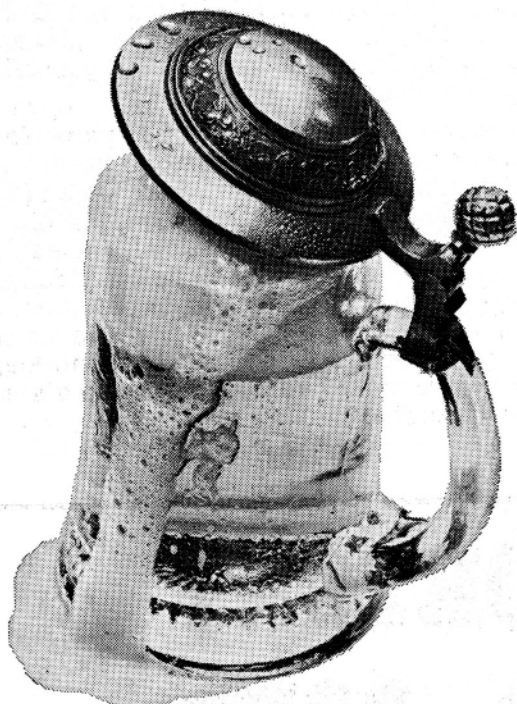
Wiel's...Wielemans Kwaliteitstraditie sinds 1862

Diploma hotelschool Feestzaal ter beschikking