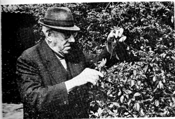
Bereidwillig geschonken door AN-HYP - Private Spaarkas

Hij is in de Heemkundige Kring van het Vaartland de man die het doet. Die leden lijmt en die tussendoor ook van die uit het leven gegrepen verhalen schrijft.