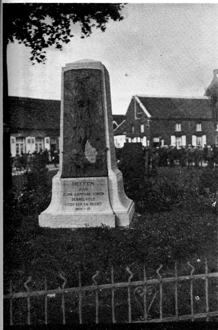
Het monument van de gesneuvelden van 1914 - 18.

Ende trocken ute metter nacht bernende met sulpherviere. Soe vreeselic ende soe onghetiere oft de duvel uter hellen hadde gheweest ende sine ghesellen rechte neder ter Schelde waert.