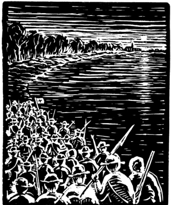
Boeren trekken op langs de Willebroekse Vaart. (Lino van Jacqui van Laer)

Niet alleen worden de openbare bidstonden als staatsgevaarlijk uiteengerammeld tot ze ten slotte van 't zelfde laken een broek krijgen. Maar ook de godsdienstplechtigheden in particuliere huizen komen verdacht voor en worden bevochten. De 20 jan. reeds vraagt Commissaris Hermans wat er hem te doen staat tegen dergelijke volksverzamelingen. Waarop Levègue hem de volgende raadgevingen laat horen in zijn circulaire van 26 april. «Er dienen nauwkeurige inlichtingen ingewonnen omtrent de aard dezer vergaderingen en de personen die er deel aan nemen.