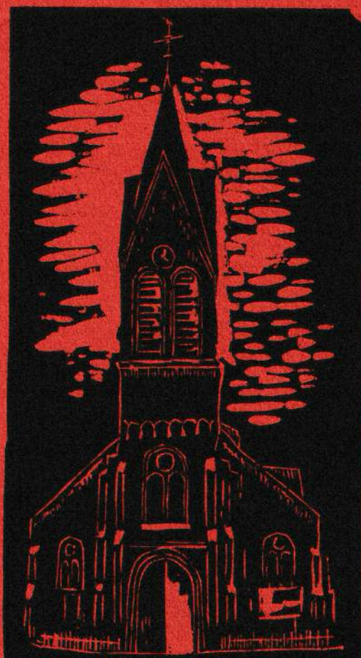
De kerk van Sint Jan Baptist te Tisselt.